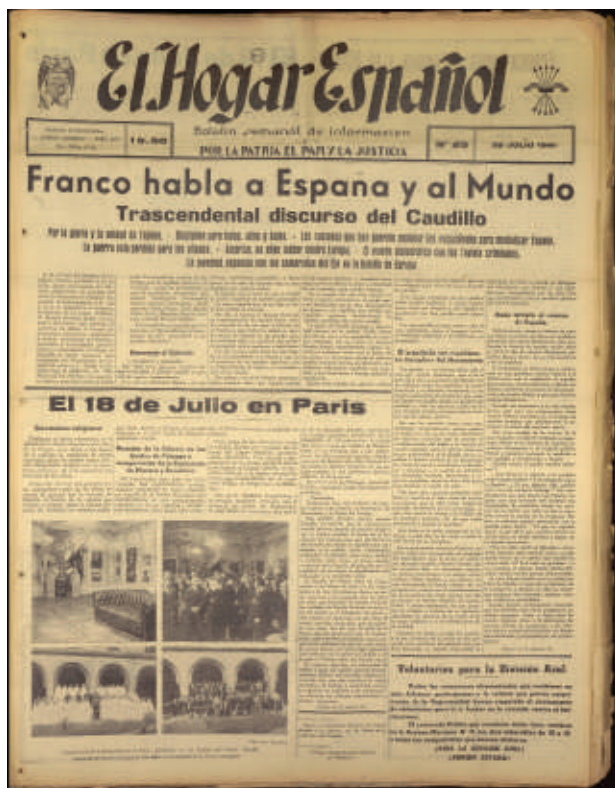
Fig. 2.-Primera página de El Hogar Español , n° 25, París, 26 de julio de 1941, con cuatro fotografías alusivas a los actos conmemorativos del 18 de julio, entre ellas dos de la Primera Exposición de Artistas Españoles de la Escuela de Bellas Artes de Falange.

sobre la guerra mundial y en concreto sobre la División Azul; 12 y todo aquello referido a las actividades de Falange en Francia con una retórica y estilo no alejado de prensa como Arriba . [Fig. 2]