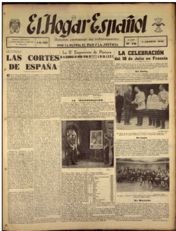
Fig. 3.-Primera página de El Hogar Español , n° 78, París, 8 de agosto de 1942.

miembros de la academia, sino de cualquier compatriota. 32 El lugar de exposición no quedaba atado, 33 y por problemas de transporte en alguno de los envíos de provincias se pospuso la inauguración al 1 de agosto a las tres de la tarde. 34 No fue hasta el 25 de julio cuando se oficializó el lugar de la muestra, el Gran Salón de los locales de Falange en el 11 de la Avenida Marceau, y el jurado. 35