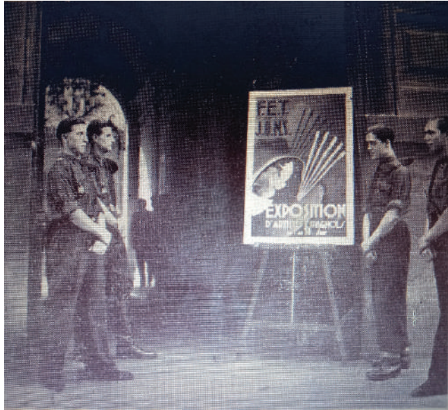
Fig. 4.-Cartel de la Segunda Exposición de Artistas Españoles de FET y de las JONS junto a miembros de Falange en el Hogar Español de la avda. Marceau.

La Segunda Exposición de Pintura de la Academia de Bellas Artes de FET y de las JONS, contó con un total de ciento seis obras de pintura, escultura y cerámica y entre los expositores figuran también algunos artistas franceses, que, como se debe, a título de hospitalidad, comparten en la Academia el trabajo de sus compañeros españoles 36 . [Figs. 3 y 4].